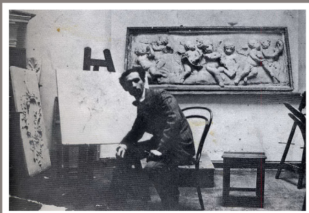
В мастерской. 1917 г.

Среда – средой, но всегда под рукой улицы Парижа, как когда-то Петербурга, сонм музеев, можно посещать лекции на правах вольного слушателя. Вот в эту жизнь и окунается Яков. Продолжает изучать архитектуру, увлекается историей и философией. Из художников его больше всего привлекают Дюрер, Рембрандт, Гойя. Все это наслаивается на предыдущий личный опыт. Неудиви-