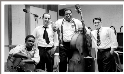
Так братья Чесс выглядят в фильме, темнокожие музыканты изображают Джими Роджерса и Вилли Диксона